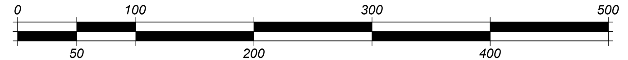
СХЕМА РОЗТАШУВАННЯ ТЕРИТОРІЇ У ПЛАНУВАЛЬНІЙ СТРУКТУРІ НАСЕЛЕНОГО ПУНКТУ. М 1:2000.